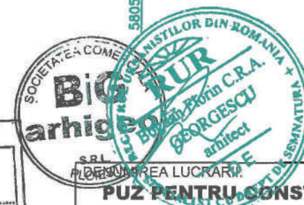
PLAN DE SITUATIE sc 1:500