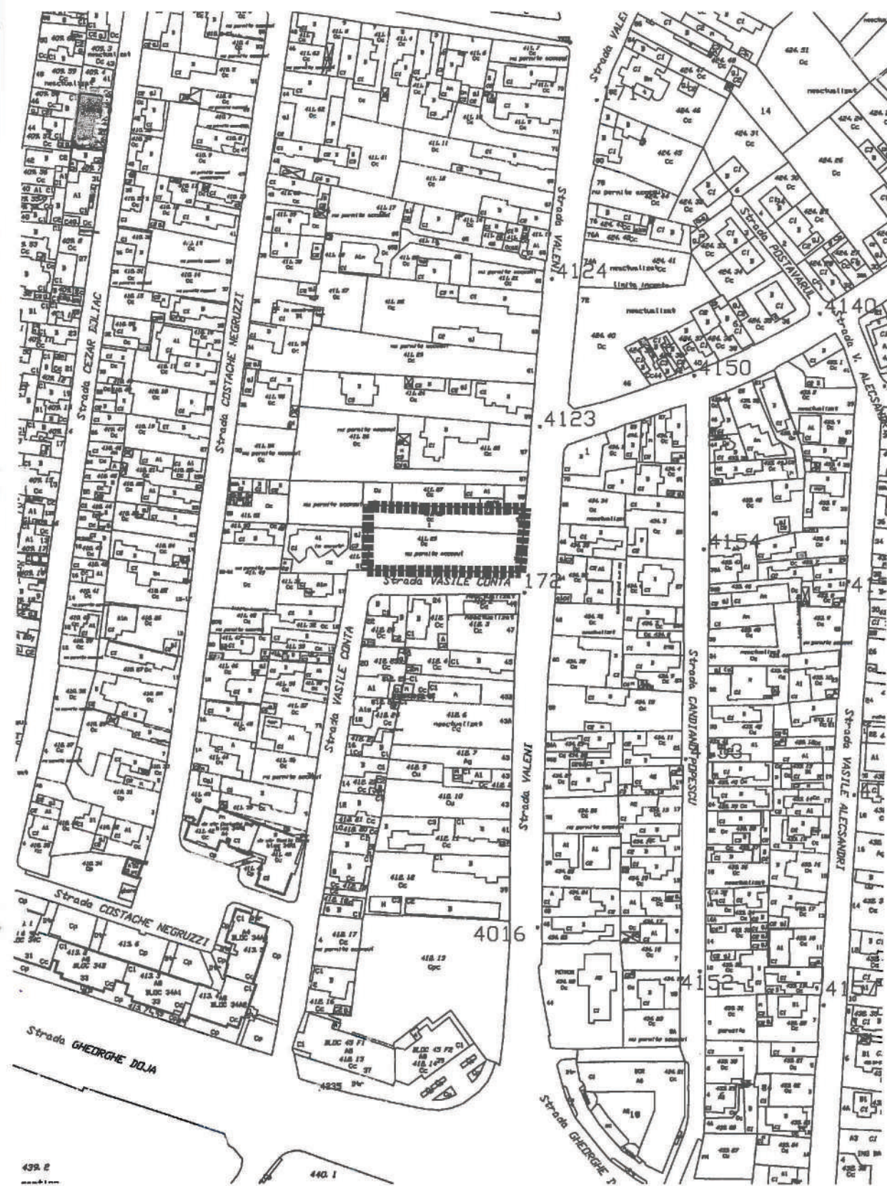
PLAN DE INCADRARE sc 1:2000

Canalizare telefonica cablu telefonic aerian